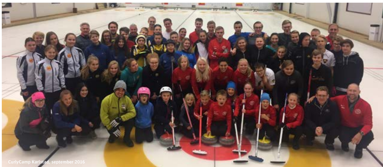
CurlyCamp Karlstad, september 2016